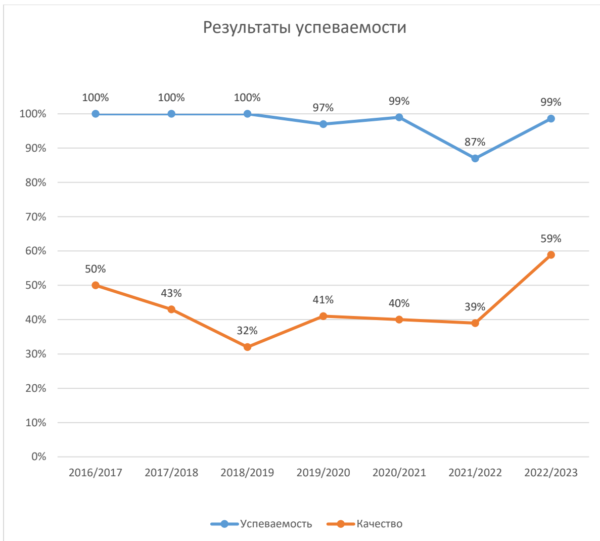
Результаты успеваемости и качества образования в ЧОУ «Школа Народного Искусства Императрицы Александры Федоровны» 2022 -2023 уч. г.